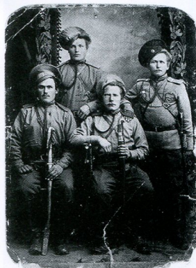
На первой странице обложки: Казачи 2-ой Оренбургской батареи. 1912–1916 гг.

Музей истории с. Париж Нагайбакского района Челябинской области.